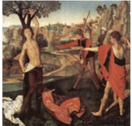
Hans Memling: Den hellige Sebastians martyrium

Forleden drøftede jeg med en af mine kolleger, hvilke salmer vi skulle synge i dag ved Allehelgens-gudstjenesten, og min kollega undrede sig over, at jeg havde valgt Brorsons "Den store hvide flok, vi se...".