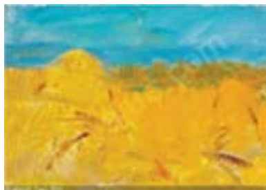
Oluf Høst: Høstet korn